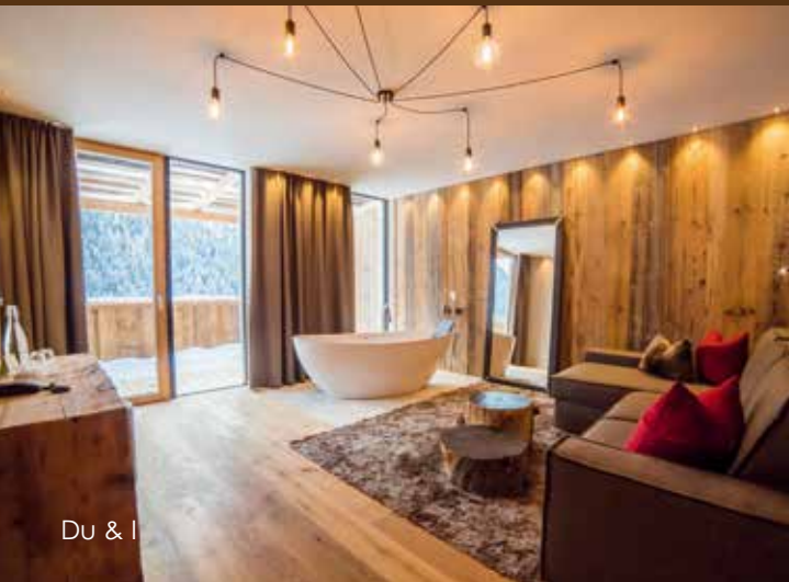
Du & I