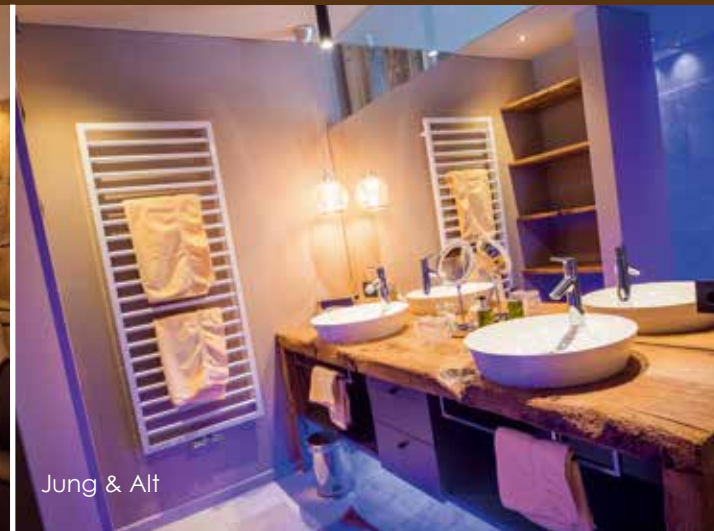
Jung & Alt